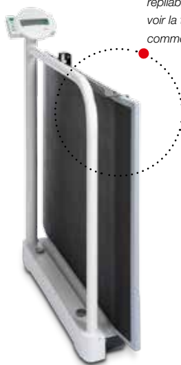
La balance est repliable pour pouvoir la transporter commodément.

L'écran pivotant placé à hauteur des hanches assure un grand confort d'utilisation au médecin et au personnel soignant. Après la pesée, ce dernier peut d'abord s'occuper tranquillement du patient, sachant que grâce à la fonction HOLD, le résultat de la mesure reste en mémoire. Une simple pression sur la touche TARE permet de prendre en compte le poids de tous les équipements auxiliaires, tels que siège ou fauteuil roulant, utilisés. La balance possède en outre une fonction IMC / BMI.