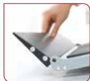
La rampe intégrée peut être repliée vers le haut pour un transport sans problème.

Après la pesée, la seca 677 se replie et se range en deux temps trois mouvements. Le dispositif d'arrêt fixe entre le garde-corps et le plateau confère une grande stabilité à la balance même une fois pliée. De plus, la main courante servant alors de poignée, la seca 677 se déplace facilement sur ses roulettes, sans qu'un effort physique soit nécessaire. Elle peut donc être transportée et rangée rapidement.